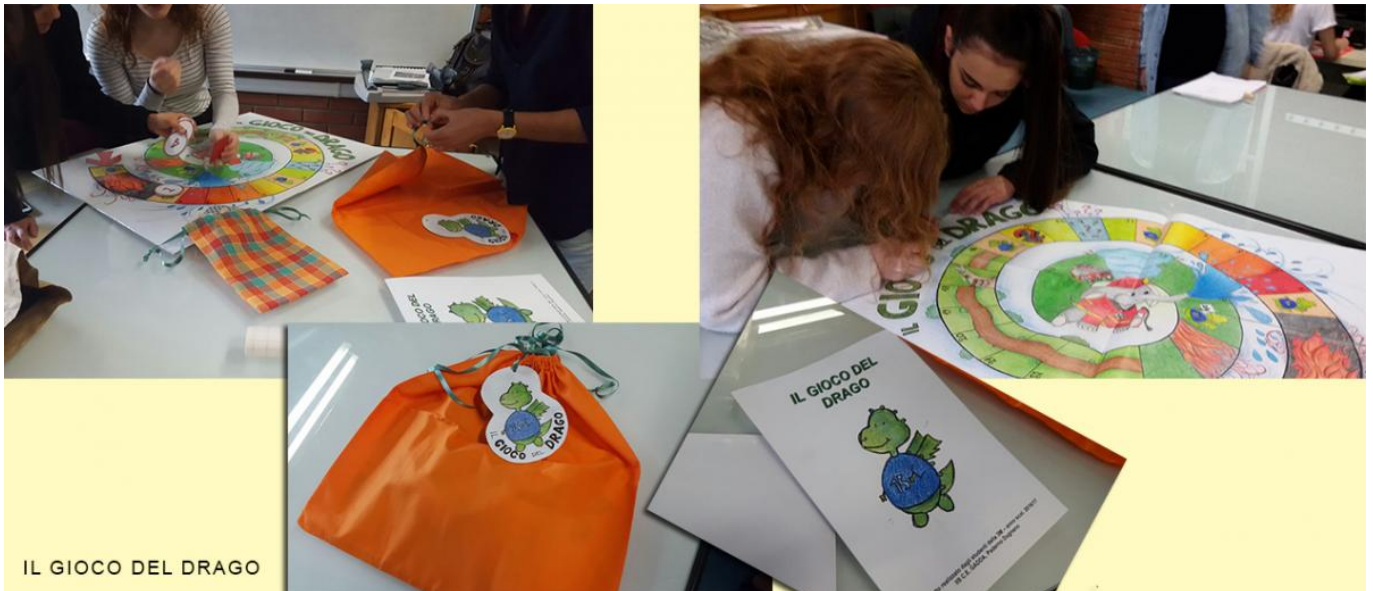
IL GIOCO DEL DRAGO

Gli studenti di una classe dell'indirizzo "Grafica e comunicazione" del 1° anno del 2° biennio progettano e realizzano due varianti del gioco del Memory: