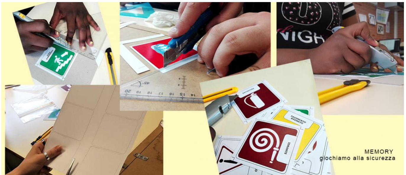
MEMORY giochiamo alla sicurezza

1° variante: tessere classiche che riproducono la segnaletica di sicurezza presente nelle scuole;