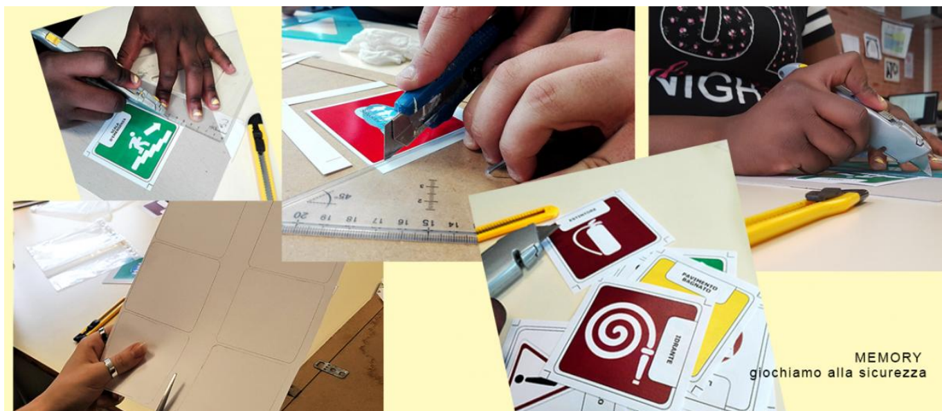
MEMORY giochiamo alla sicurezza

1° variante: tessere classiche che riproducono la segnaletica di sicurezza presente nelle scuole;