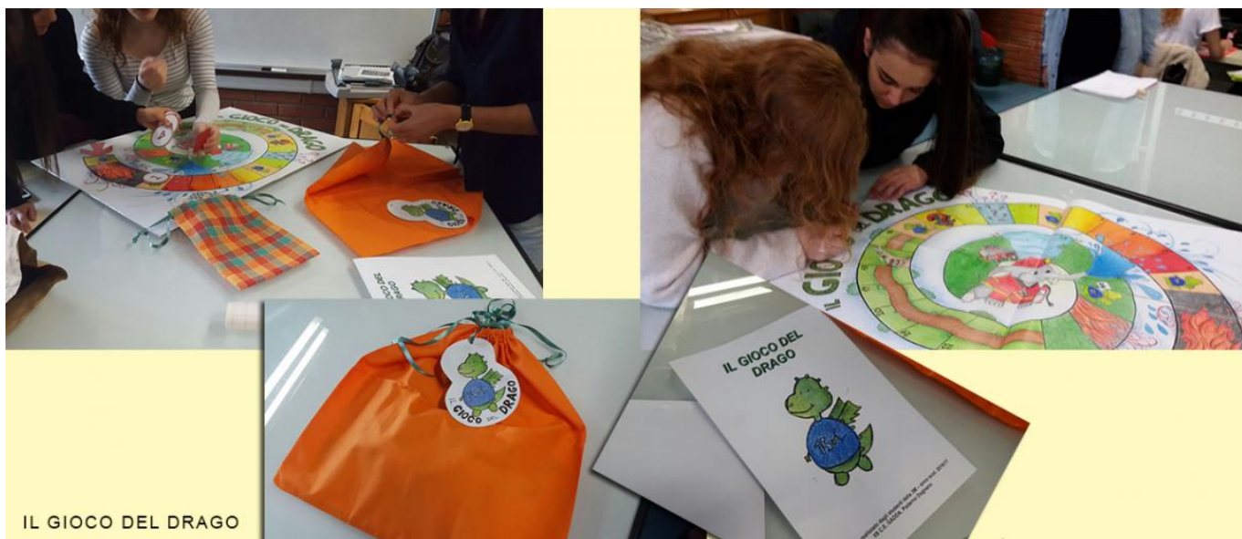
IL GIOCO DEL DRAGO

Gli studenti di una classe dell'indirizzo "Grafica e comunicazione" del 1° anno del 2° biennio progettano e realizzano due varianti del gioco del Memory: